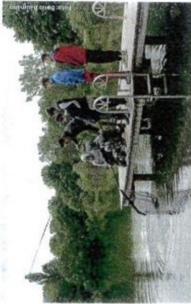
Mit der Bürgerstiftung konnten wir den Anbau der Fischerhütte am Feiglwäher und die Ausbildung unserer Jungfischer unterstützen.