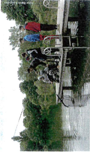
Mit der Bürgerstiftung konnten wir den Anbau der Fischerhütte am Heiglweiher und die Ausbildung unserer Jungfischer unterstützen.