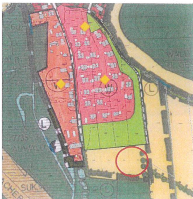
Abb. 3 Lage des Plangebiets im rechtswirksamen FNP inkl. der 9. Änderung, ohne Maßstab, Quelle: RIWA Gis

Im rechtswirksamen Flächennutzungsplan der Gemeinde Haimhausen vom 07.08.1992 inkl. seiner 9. Änderung vom 20.05.2010 ist das Plangebiet als landwirtschaftliche Fläche dargestellt. Im Westen sind Gehölzstrukturen dargestellt. Umgeben wird das Gebiet lt. FNP von landwirtschaftlichen Flächen und im Süden von Wald sowie westlich und südlich vom LSG.