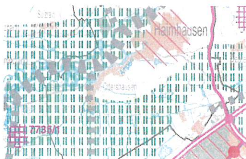
Abb. 2 Auszug Regionalplan mit Biotopverbundsystem und Regionalem Grünzug, Quelle: Regionalplan, Stand 04.08.2023

Die westliche Siedlungsfläche Ottershausens liegt im Regionalen Grünzug Nr. 3 „Ampertal“ sowie im Landschaftlichen Vorbehaltsgebiet „Östliches Dachauer Moos und Randbereich der Amperaue“ (04.5).