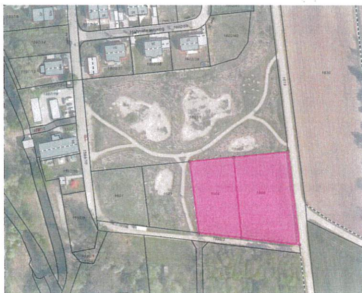
Abb. 1 Plangebiet, ohne Maßstab

Beim Änderungsbereich handelt es sich um einen Acker in sensibler Lage. Das Plangebiet grenzt östlich und südlich unmittelbar an das Landschaftsschutzgebiet „Amperauen mit Hebertshäuser Moos und Inhäuser Moos LSG-00342.01“ an. In näherer Umgebung, (100 m westlich gelegen) liegt das Biotop Nr. 7735-0003 „Schwebelbach und begleitende Au- und Feuchtwaldbereiche.